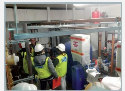
Sorties pédagogiques (Place aux gestes, visites de chantier, forum métiers)