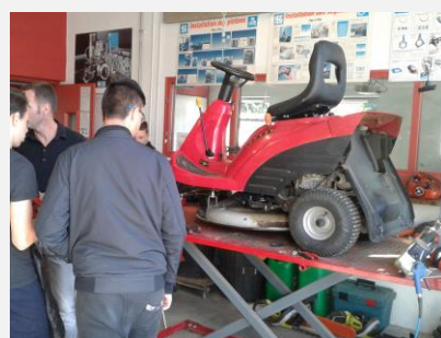
Visites de Centre de Formation pour Apprentis