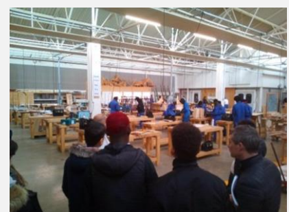
Visites de Lycées professionnels