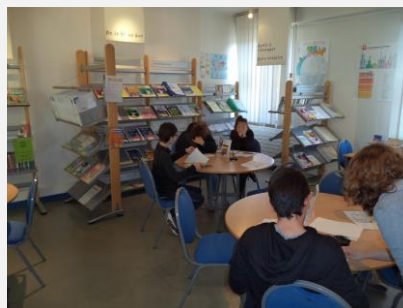
Visites du CIO (Centre d'Information et d'Orientation)

Les heures de découvertes professionnelle servent également à élaborer le projet d'orientation de l'élève afin de trouver une voie professionnelle après la 3 ème . Le CFG (Certificat de Formation Général) est également préparé (dossier + oral).